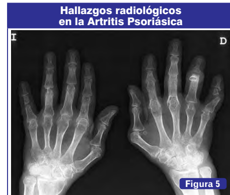
Imagen de lápiz en copa y anquilosis ósea.

En la AR y APs la sinovitis es de intensidad moderada a severa, centrando el cuadro clínico del paciente. En cambio en las conectivopatías la sinovitis suele ser leve. Si la artritis es severa y domina el cuadro clínico hay que sospechar otros diagnósticos como una AR o un solapamiento con AR o que se trate de una EMTC que es de las conectivopatías, la que puede asociar un compromiso articular severo (5,6) .